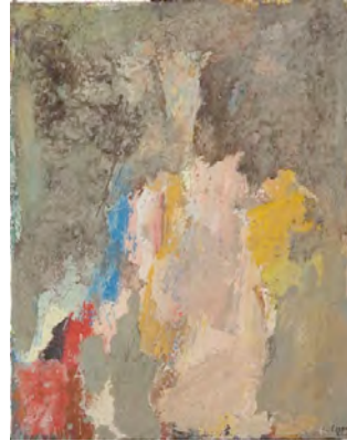
Nu rose, 1956 Collection MUba Eugène Leroy, Tourcoing