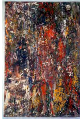
L'Eté, 1993. LaM, Villeneuve d'Ascq. Photo : DR. © Adagp Paris, 2010