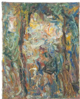
Paysage, ca 1967 Donation Eugène Jean et Jean-Jacques Leroy, MUba