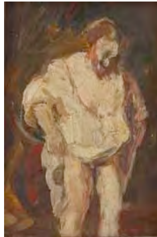
Hendrickje prend un bain dans une rivière d'après Rembrandt, ca 1935 Collection Privée Pommerain