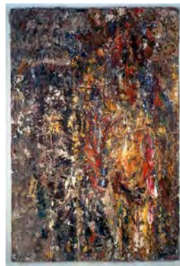
L'Hiver, 1993. LaM, Villeneuve d'Ascq. © Adagp Paris, 2010