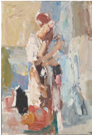
Etreinte, 1956 Collection privée, Paris