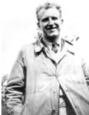
Eugène Leroy en 1977

Eugène Leroy est né à Tourcoing en 1910. Il a toujours vécu et travaillé dans la métropole lilloise, a fait ses études à l'Ecole des Beaux-Arts de Lille, a enseigné à Roubaix et meurt à Wasquehal 2000.