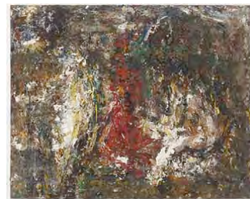
Le Concert Champêtre, Collection privée