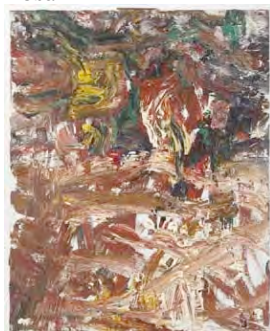
Marina en Ides de mars