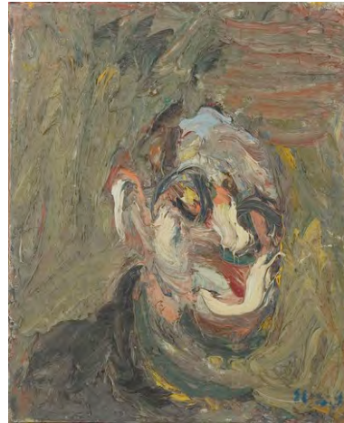
Tête, 1967 Collection privée, Paris