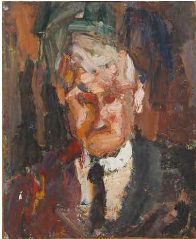
Papa Thirant, ca 1950 Donation Eugène Jean et Jean-Jacques Leroy, MUba