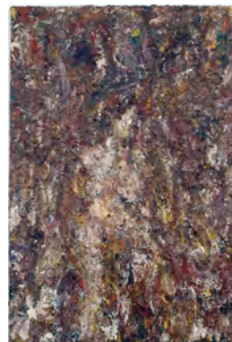
Annemie (1982-86), Collection FRAC Nord-Pas de Calais