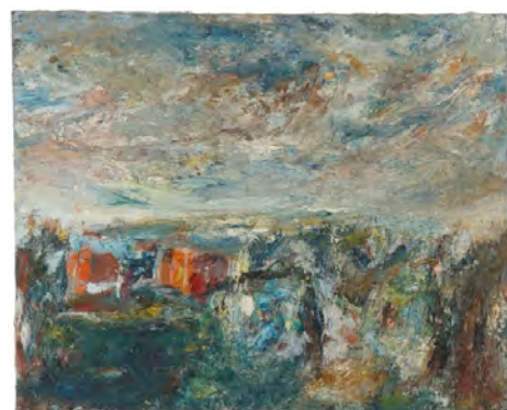
Paysage, 1966 Collection Musée Roanne, Dépôt MUba