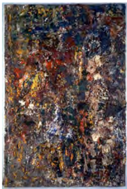
L'Automne, 1993. LaM, Villeneuve d'Ascq. Photo : DR. © Adagp Paris, 2010