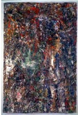
Le Printemps, 1993. LaM, Villeneuve d'Ascq. Photo : DR. © Adagp Paris, 2010