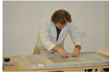
La restauration de la Donation Eugène Jean et Jean-Jacques Leroy, MUba