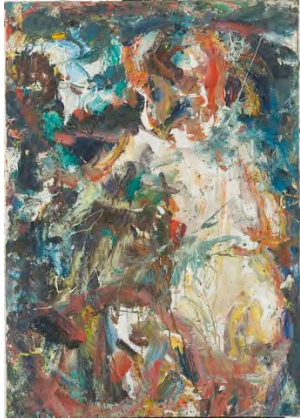
Nu, ca 1965 Donation Eugène Jean et Jean-Jacques Leroy, MUba