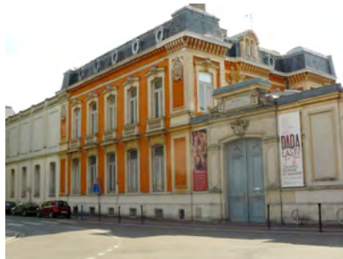
Vue du MUba Eugène Leroy | Tourcoing