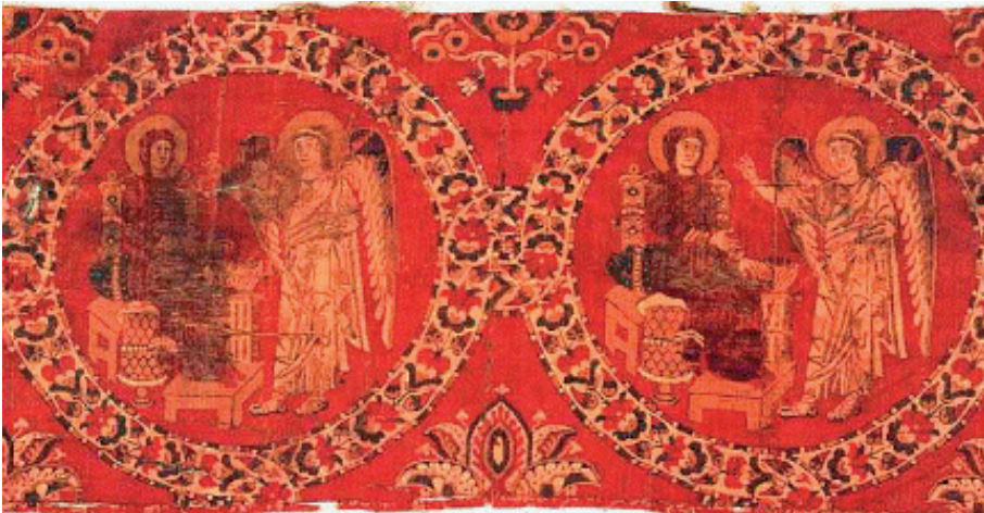
Tissu de soie avec scène de l'Annonciation

Aujourd'hui, dans certaines régions, la crise destructrice pour tous que traverse le Proche et le Moyen Orient, menace les Chrétiens dans leur existence. Au-delà du drame humain que cela représente, au-delà des craintes pour la préservation d'un patrimoine matériel et immatériel deux fois millénaire, c'est la question de la diversité du monde arabe qui est en cause.