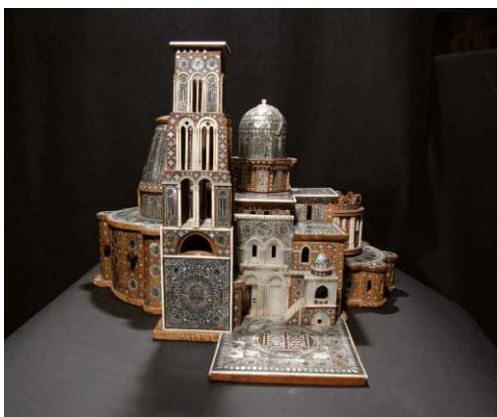
Maquette du Saint-Sépulcre Jérusalem, Bethléem XVIIIe siècle

C'est au XVIème siècle que le Pape, chef des chrétiens catholiques commence à s'intéresser aux chrétiens d'Orient. L'enseignement de l'arabe est favorisé afin de former des missionnaires, les évangiles sont édités en arabe grâce au cardinal Ferdinand de Médicis. En 1576, un collège grec est fondé à Rome, puis en 1584 un collège maronite, ce qui permet de développer l'enseignement catholique à destination des chrétiens d'Orient.