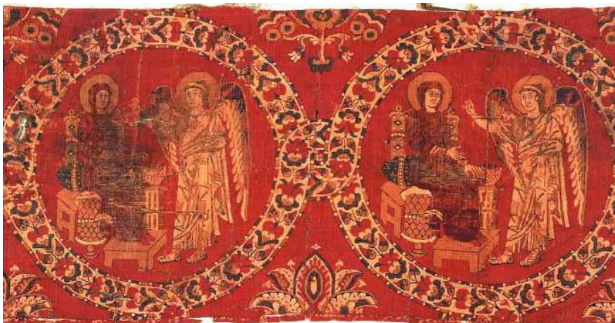
Tissu de soie avec scène de l'Annonciation Syrie (?), vers 800 Soie polychrome, tissage en sergé

Aujourd'hui, dans certaines régions, la crise destructrice pour tous que traversent le Proche et le Moyen-Orient, menace les chrétiens dans leur existence. Au-delà du drame humain que cela représente, au-delà des craintes pour la préservation d'un patrimoine matériel et immatériel deux fois millénaire, c'est la question de la diversité du monde arabe qui est en cause.