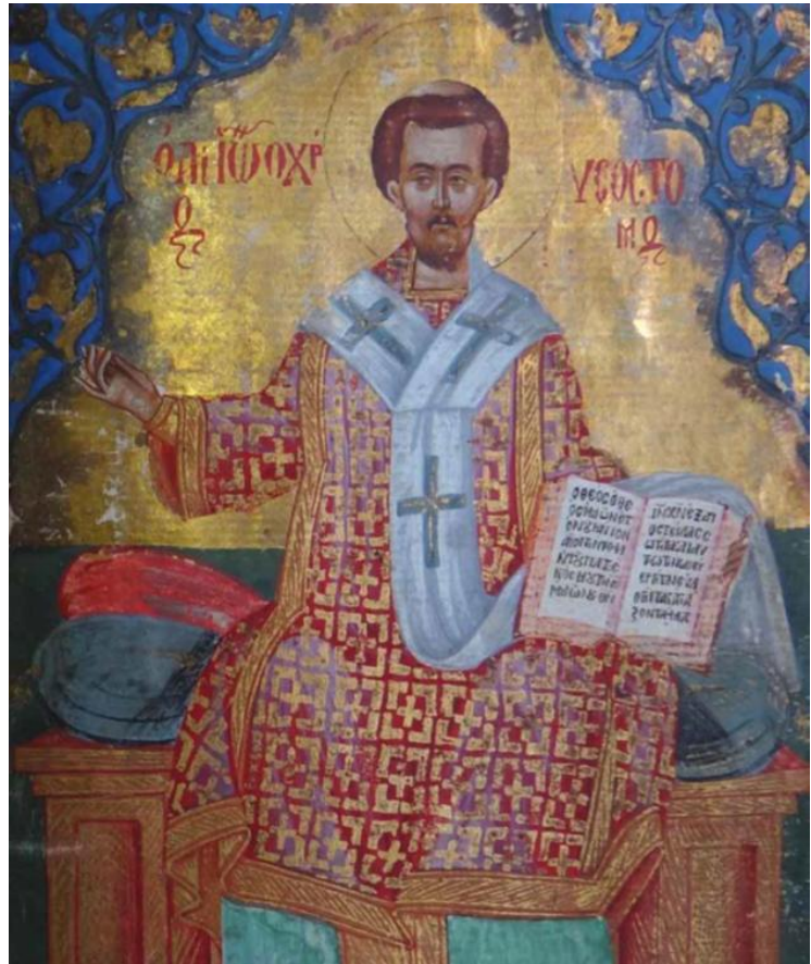
Livre de prière syriaque-arabe (Qondaq) Syrie, XVIIe siècle