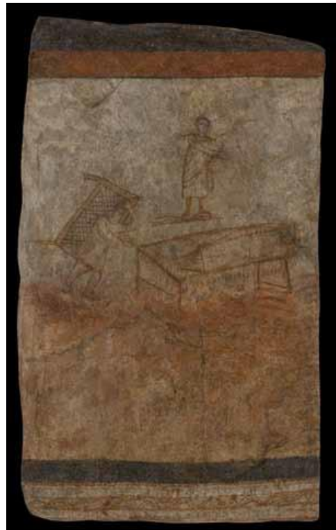
Fresque représentant la guérison du paralytique Doura-Europos, Syrie, III e siècle

Ce sont ses disciples qui vont alors affirmer que Jésus est le Messie et qu'il est ressuscité trois jours après sa mort. Les juifs hellénisés vont accueillir très favorablement ce message. Leur éducation leur permettant de lire la Bible dans sa traduction grecque. Ils l'appellent alors Jésus le Christ, traduction grecque du mot Messie.