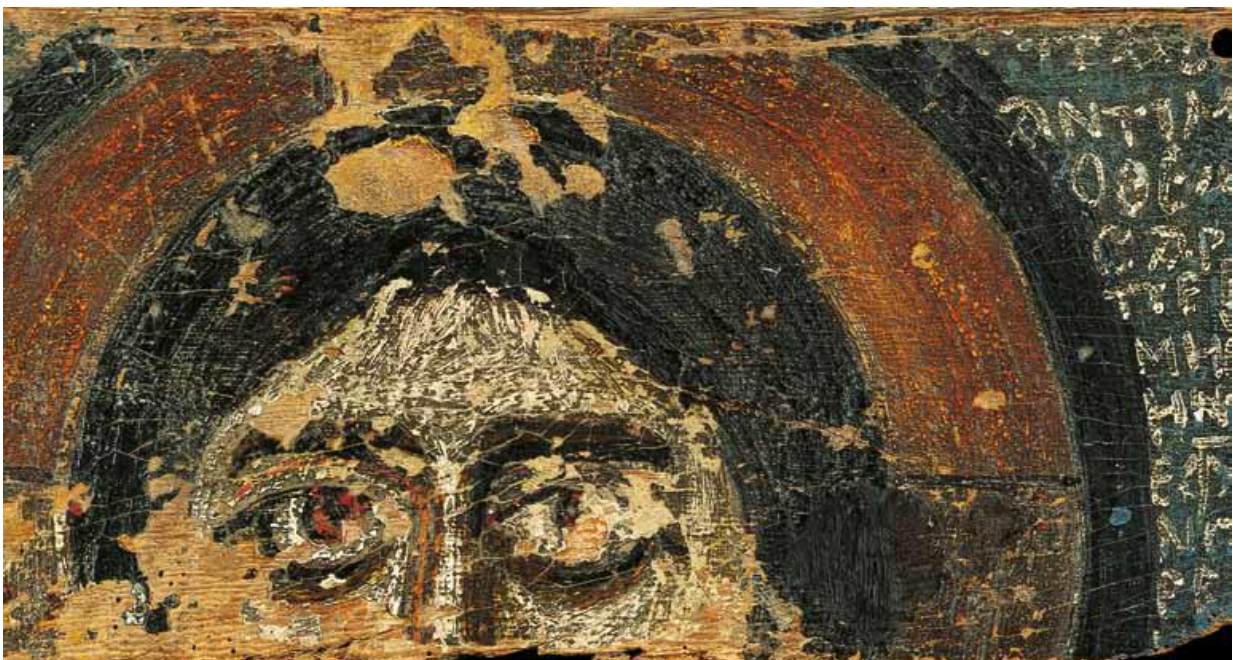
(détail) Fragment d'une icône avec représentation du Christ Égypte, VII e -VIII e siècle – Bois

Le terme de chrétien est employé pour la première fois à Antioche en 40 de notre ère. L'empereur Néron les rendra responsable de l'incendie de Rome en 64 de notre ère.