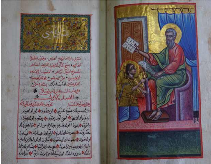
Évangile arabe – Illustré par Ne'meh al-Musawwir (attri.) Syrie, 1675

Les chrétiens restent jusqu'au Xème siècle majoritaires, et dans certaines régions jusqu'au XIIème siècle. Les langues traditionnellement utilisées par les chrétiens (coptes, grecs et syriaques) sont petit à petit délaissées au profit de l'arabe. La Bible est traduite en arabe, et les écrivains chrétiens produisent des textes en arabe donnant naissance à un christianisme de langue arabe. Dans les congrégations, des artisans juifs, chrétiens et musulmans se côtoient. On remarque que certaines techniques et certains motifs sont partagés par les trois religions.