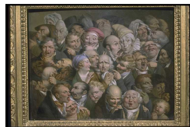
© Louis-Léopold Boilly Collection MUba Eugène Leroy | Tourcoing