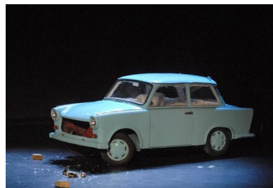
© Sean Mackaoui pour L'Interlude T/O