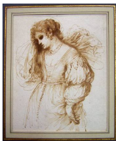
© Le Guerchin, dessin Collection MUba Eugène Leroy | Tourcoing